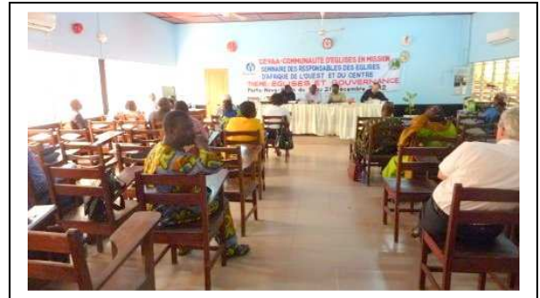
Photo Séminaire Gouvernance Cevaa Porto Novo 12.12