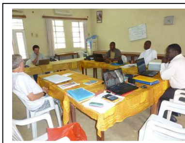
Réunion du Bureau à Lomé 03.12