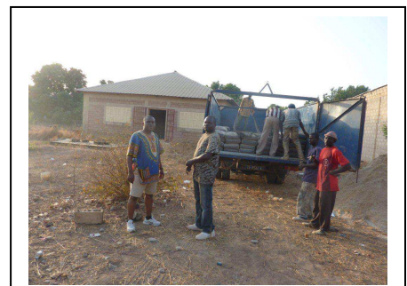
Centre Polyvalent en Casamance Programme Missionnaire EPS (Sénégal)