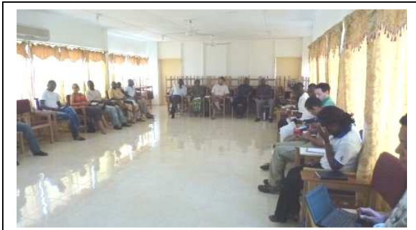
Photo séminaire Jeunesse Cevaa Ghana

D'autre part, le Secrétariat du SECAAR a participé au séminaire organisé par la Cevaa sur la Gouvernance au sein des églises tenu à Porto Novo au Bénin ; les échanges eus en travaux en ateliers et plénières permettent de consolider l'utilisation de l'approche globale et participative pour une bonne gouvernance dans les églises.