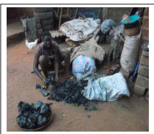
Exposé lors de la session et actions d'une participante après la session de Tsévié