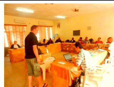
Cours Consultant combiné avec Réunion du Bureau à Kimpese 08.12 (RDC)