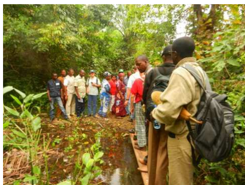
Les Consultants du SECAAR en visite de terrain à Kimpese (RDC)

De plus, l'équipe exécutive du SECAAR s'est beaucoup activée cette année dans le processus de recherche et de diversification des sources de financement à travers la soumission à des appels à projets ; ceci a permis, non seulement de faire des contacts avec certaines structures de coopération au développement (Service de Coopération et d'Action Culturelle/France, Agence Nationale d'Appui aux Initiatives de Base/Togo par exemple), mais aussi de mobiliser de petits financements au profit de groupes cibles accompagnés. Ces contacts de coopération naissante laisse espérer des partenariats pouvant déboucher sur le financement des microprojets de certains groupes de base formés et accompagnés par le SECAAR.