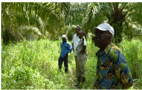
Palmeraie projet Socorobo EMUCI (Cote d'Ivoire)

Le suivi des projets et programmes des partenaires s'est poursuivi cette année avec le projet agropastoral de Socorobo (Côte d'Ivoire), le projet intégré de Farendé (Togo) ; la mission prévue cette année pour le projet missionnaire de l'Eglise Protestante du Sénégal n'a pas pu se tenir à cause des problèmes internes à l'église. Il est à remarquer que grâce à l'appui/accompagnement du SECAAR ces projets se déroulent mieux ; celui de Farendé mobilise à ce jour, plusieurs partenaires (Un groupe d'Etudiants de l'Université de la Caroline USA, le Lycée du village, le Comité Villageois de Développement de Farendé, le Centre Médico-Social de l'EEPT Farendé) par des interventions diverses (appui financier et matériel, contribution en ressources humaines etc.), ce qui fait de ce projet « un pôle de développement intégré de la localité. L'évaluation de ces projets dans le courant de cette année 2013 permettra de tirer des leçons partageables au sein du réseau et aussi avec les partenaires du SECAAR.