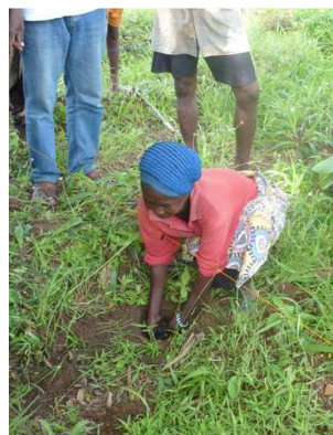
Opération Reboisement Projet Farendé EEPT (Togo)