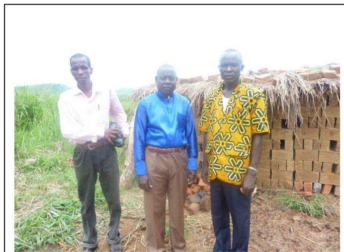
Le Pasteur de l'Eglise de Ouango à Bangui a mis en place une briqueterie avec les jeunes de sa paroisse grâce aux cours de développement holistique