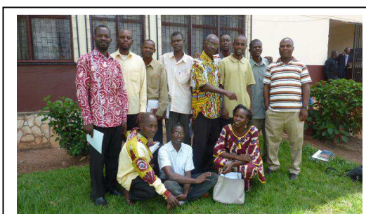
Cours dispensé aux étudiants de la FATEB (RCA)

Dans les institutions comme la FATEB où le SECAAR intervient depuis 4 ans, il est désormais question, d'accompagner cette faculté à recycler une ou deux personnes désignées selon les critères spécifiques propres à l'institution pour la prise en charge de l'enseignement de ce cours sur le plan local ; ce transfert de compétences débutera réellement avec l'intervention de cette année 2013.