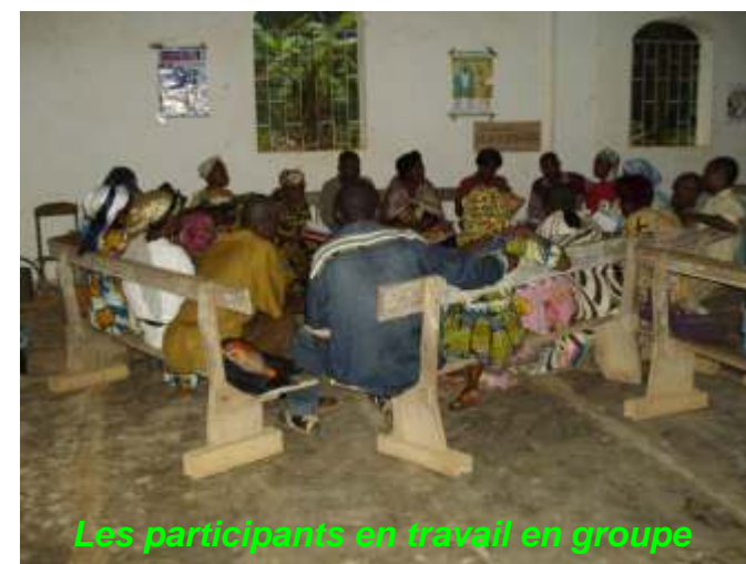
Les participants en travail en groupe