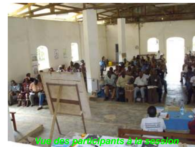
Vue des participants à la session

paroissiens de Bingambo qui ont également apprêté une nourriture abondante.